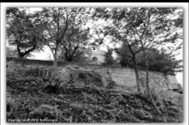
Església de la Mare de Déu del Carmel