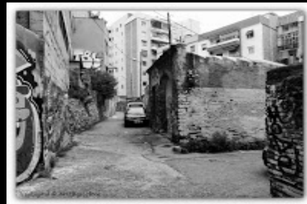
Torrent de Lligalbé