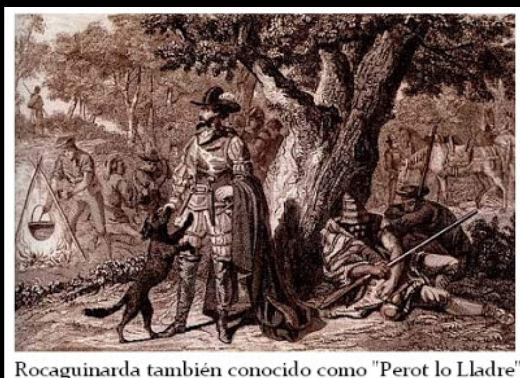
Rocaguinarda también conocido como "Perot lo Lladre"

—No estéis tan tristes, buen hombre, porque no habéis caído en las manos de algún cruel Osiris, sino las de Roque Guinart, que tiene más de compasivas que de rigurosas."