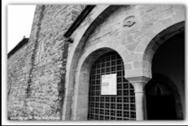
Mare de Déu del Coll