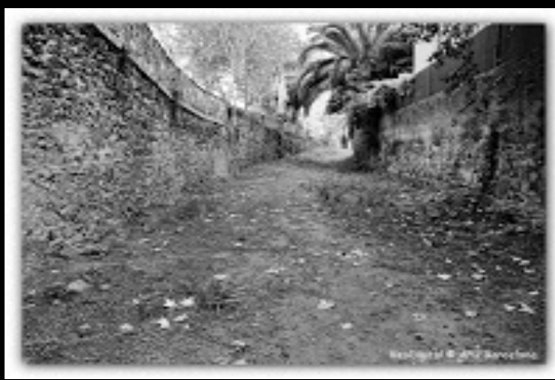
Torrent de Carabassa