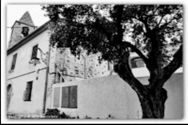
L'església de Sant Genís dels Agudells