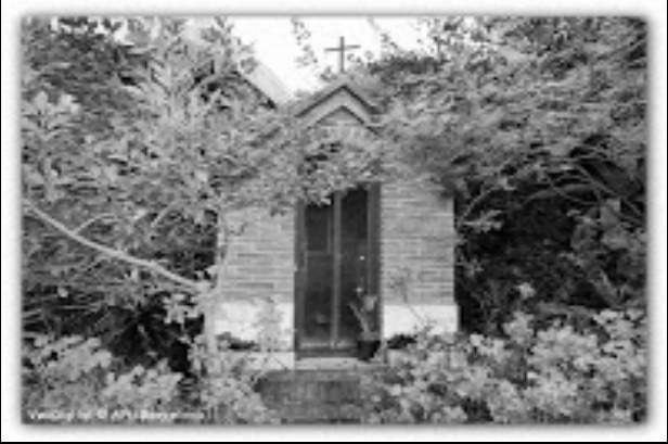
Parròquia del Sant Crist