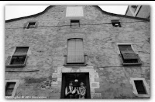
Mas Can Baró