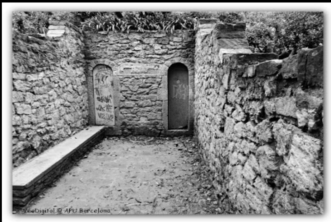
Parc del Guinardó Font del Cuento