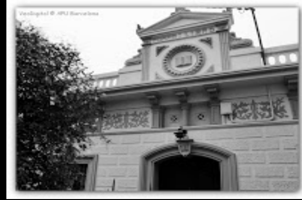
Torre del libro