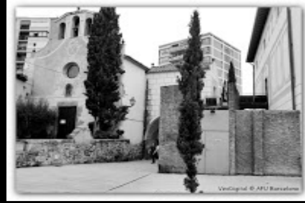
Parròquia de Santa Eulalia de Vilapicina